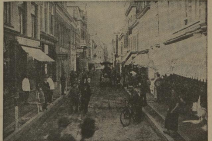
De Folkingestraat ± 1920.

Het was een drukke straat, het was een Joodse straat, de Folkingestraat van voor de oorlog. Verreweg de meeste bewoners waren Joden, bevriend met de christenen die zich als eilandjes in de Joodse zee bevonden. Niet alleen door de bewoners kreeg de Folkingestraat in het Groningen van voor de oorlog. maar ook doordat de centra van het geestelijke, religieuze en materiële Joodse leven zich in of vlakbij deze straat bevonden: het opperrabbinat, het administratieve apparaat van de Joodse gemeente, de synagoge, het leerhuis (Ets Chajiem) en de godsdienstschool. Ook de velen die toentertijd nog een kosjere 1) huishouding hadden waren voor de inkoop van de kosjere etenswaren vooral op de Folkingestraat aangewezen. En 's zondags was het één grote bedrijvigheid, omdat dan vele niet-Joodse Groningers naar de Folkingestraat trokken om vers brood: galletjes, galles (met of zonder maanzaad), gebak, en verse vleeswaren te kopen.